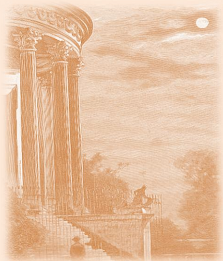
Świątynia Sybilli wg Aleksandra Gierymskiego.

Na prawo od Sybilli, obok cienkiej, żelaznej poręczy stoi kilka ław piaskowcowych, na lewo ciągnie się inna aleja niby pasaż uformowany z lip, którym kunszt ogrodniczy powyginał wierzchołki. Cienia tu tyle co w piwnicy, a gości sporo, niektórzy bowiem lubują się tym zakątkiem.